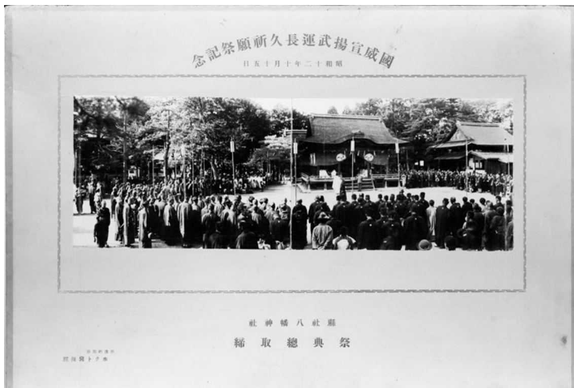
昭和12年10月15日 長浜曳山祭 国威宣揚武運長久祈願祭記念写真